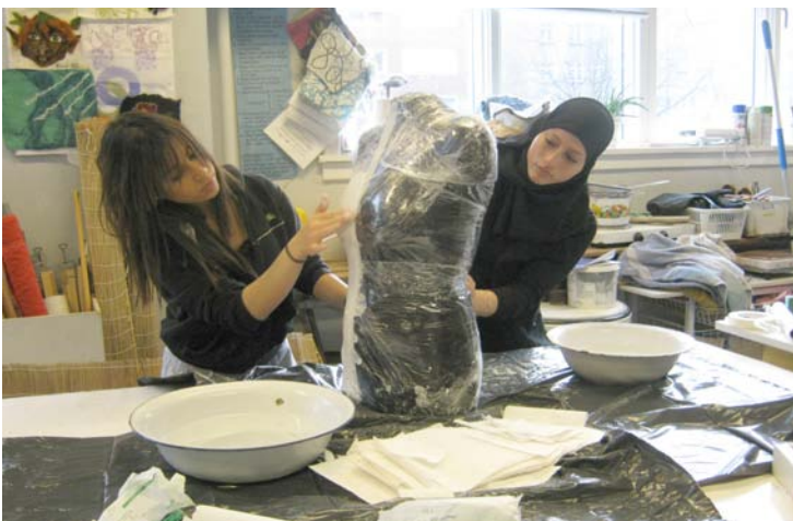
Elever fra en folkeskoles 9. kl. med formgivningsprojekt / kropsprojekt (gipsmateriale)