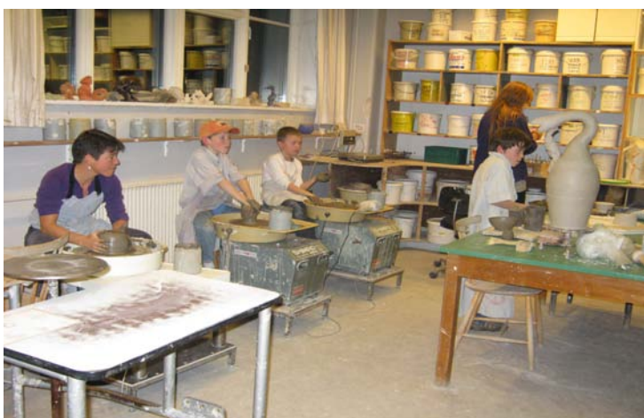
Vækstlaget eksperimenterer ved de elektriske drejeskiver