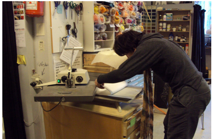
Transfer-teknik (overførsel af billeder til keramik og glas)