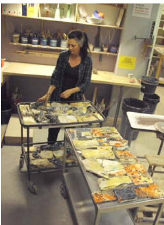
Udsmykningsopgave i stentøj til Psykiatrisk Hospital