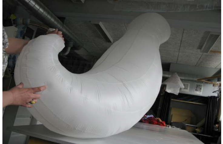
Oppustelig skulptur fremstillet i atelierets værksteder