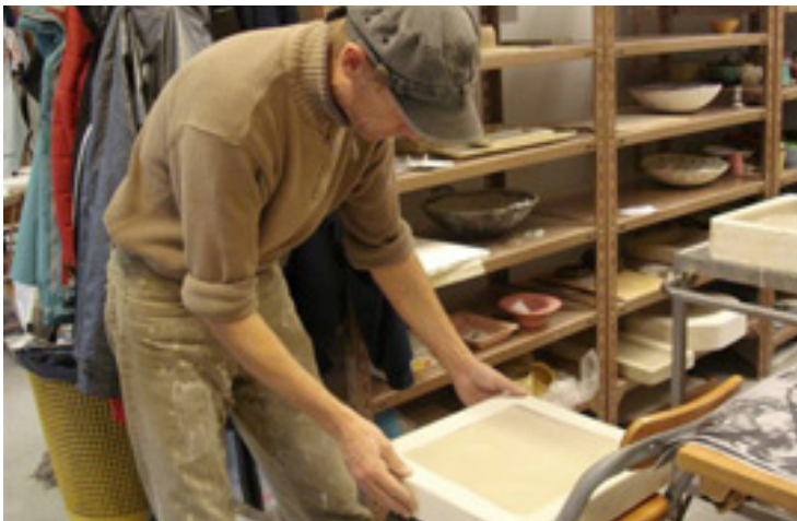
Keramik i støbeform