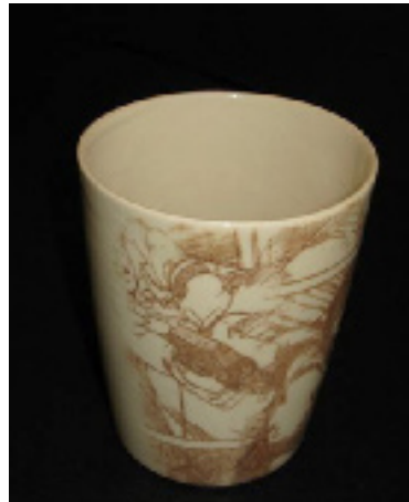
Hånddrejet keramikkrus med serigrafi dekoration