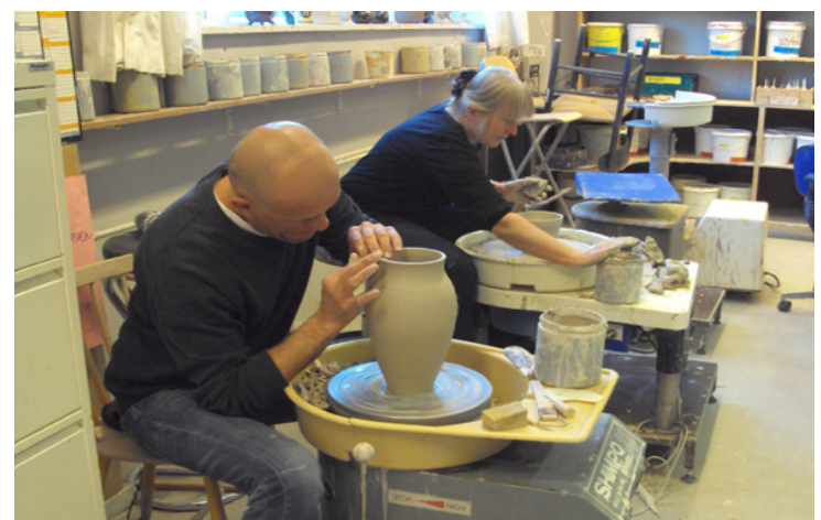
Professionelle keramikere ved elektriske drejeskiver