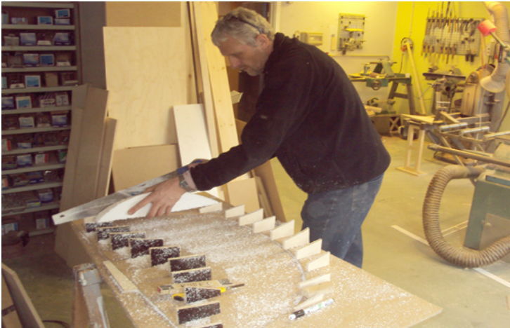
Fremstilling af modeller til Århus Kunstbygning