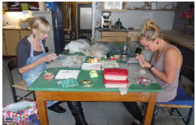
Iværksættere med smykkefremstilling i keramik