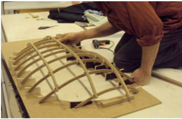
Formgivning i træmaterialer