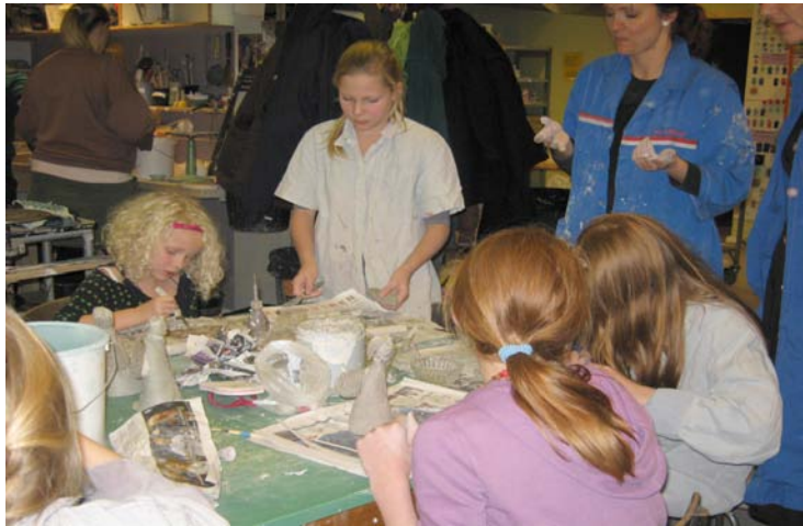
Børn og unge eksperimenterer med lerets muligheder