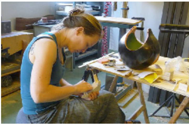
Keramikkrukke monteres på træværkstedet