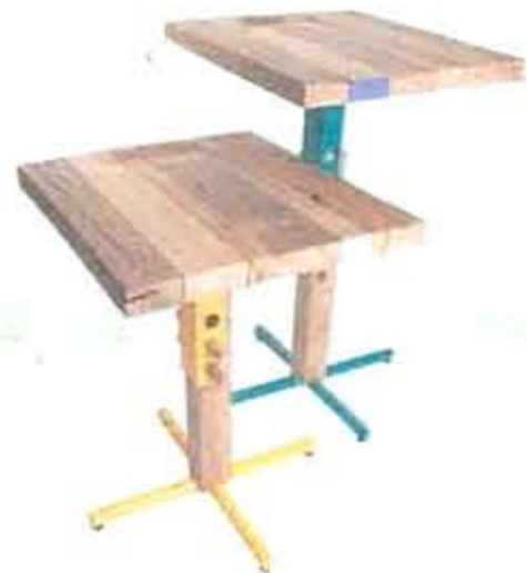
REKTABLE ER ET CAFE BORD I GENBRUGSTRÆ. DESIGNET AF TRINE KJÆR OG METTE RISBÆK JENSEN.