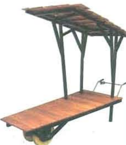
Skur + bæk + trillebar. Designet af Mads P. Laursen og Jens Hyldegaard.