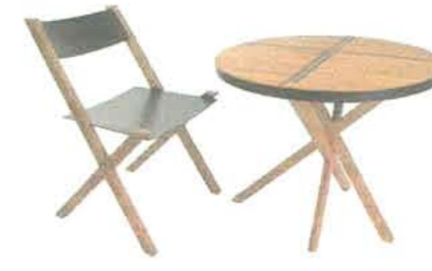
Bambus og stål. Helhed mellem bord og stol. Designet af Christian Kau.