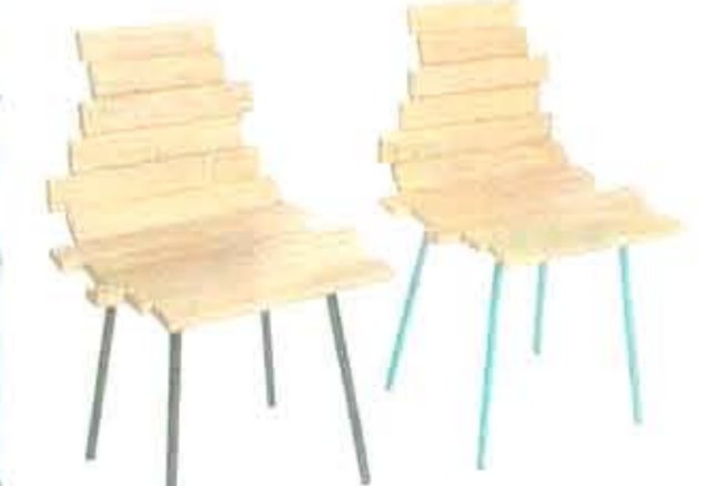
Frankchair er en ærlig stol, der bryder rammerne. Designet af Mette Schelde.